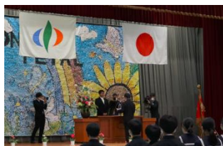
【新入生代表 誓いの言葉】