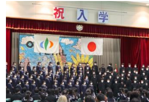
【上級生の歓迎の合唱】